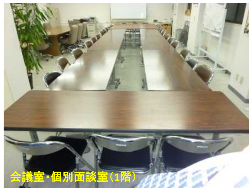
会議室・個別面談室(1階)