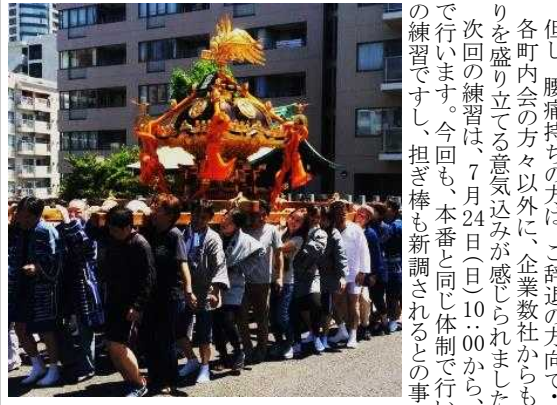
6町会の方々力が合わせて練習中