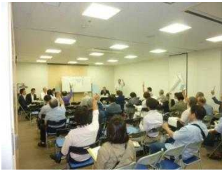
審議事項議決承認

㈱佐藤不動産鑑定コンサルティンク(不動コン)より、平成27年度内に行った事業内容を報告しました。 主な項目として、本組合の設立、施設計画案等の検討推進、権利変換計画の作成と認可申請、商業計