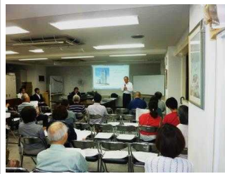
6.29開催(組合事務所1階)

2管理規約の設定(1)管理規約の設定方法 都市再開発法第百三十三条第一項の規定に基づき、都知事の認可により設定する方法が、当組合にとって適切な方法と考へます。(2)管理規約の規定の内容 総則的事項、所有に関する事項、利用に関する事項、管理に関する事項とその他の事項に大別されます。専有部分と共用部分はどこで、どの様に利用し、どの様に規制していくかを細かく決めて取りまとめます。また、管理組合の組織の決め方や役割等も細かく決められます。その他、義務違反を犯した区分所有者に対する措置も記載します。 3管理費及び修繕積立金に関する事例 6事例を用いて説明しました。【事務局】