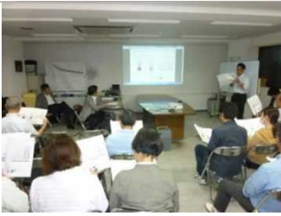
6.15開催(組合事務所1階)

説明内容は、 1構造性能 ①制振構造を採用し地震エネルギーを吸収し、地震時に躯体へのダメージを軽減する構造 ②直接基礎工法と高強度コンクリート、最大直径41ミリの鉄筋を使用した強靱な躯体を計画 2住戸内遮音性能 メンテナンス性を高めるために二重床・二重天井を採用。サッシは、現地で測定した外部騒音データに基づいて計画しています。住戸間の壁は、厚さ26cmのコンクリート壁に匹敵する遮音性能が優れた乾式耐火遮音壁を計画しています。 3住戸内環境性能 エコ対策を重視した計画。複層ガラスを採用し、断熱・遮熱性効果を高めます。節水型便器を採用し、節水に